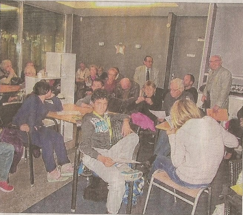
Les jeunes du CLC ont questionné les "anciens" sur leur jeunesse et la société d'autrefois.

Mercredi, le Café des âges qui fêtait ses dix ans, a accueilli, en plus du public habituel de cette manifestation, des jeunes adolescents qui étaient associés à l'événement par le biais du Centre loisirs et culture (CLC). Ces derniers ont réalisé au préalable tout un travail de préparation de cette journée pendant près d'un mois. Rappelons que le Café des âges est l'une des composantes de la Semaine Bleue, période de réflexion, de témoignage et de mise en perspective des actions entreprises ou à entreprendre concernant l'intergénérationnel. Cette semaine est riche d'événements coorganisés et portés par la Ville